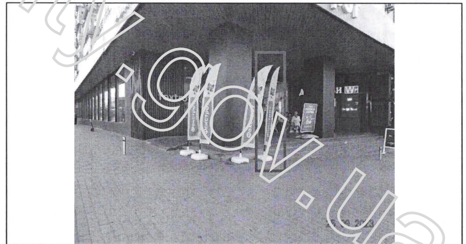
Фото фіксація розміщення: Прапор, прапорець, який використовується як рекламоносій, що стоїть окремо