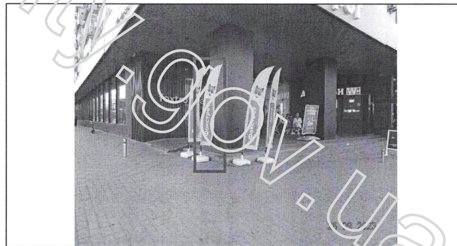
Фото фіксація розміщення: Прапор, прапорець, який використовується як рекламоносій, що стоїть окремо