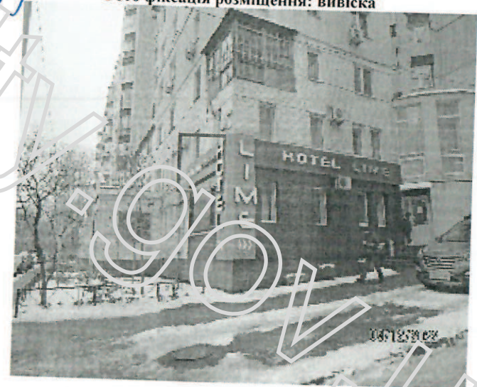
Фото фіксація розміщення: вивіска