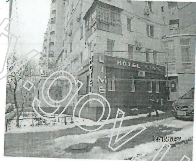
Фото фіксація розміщення: вивіска