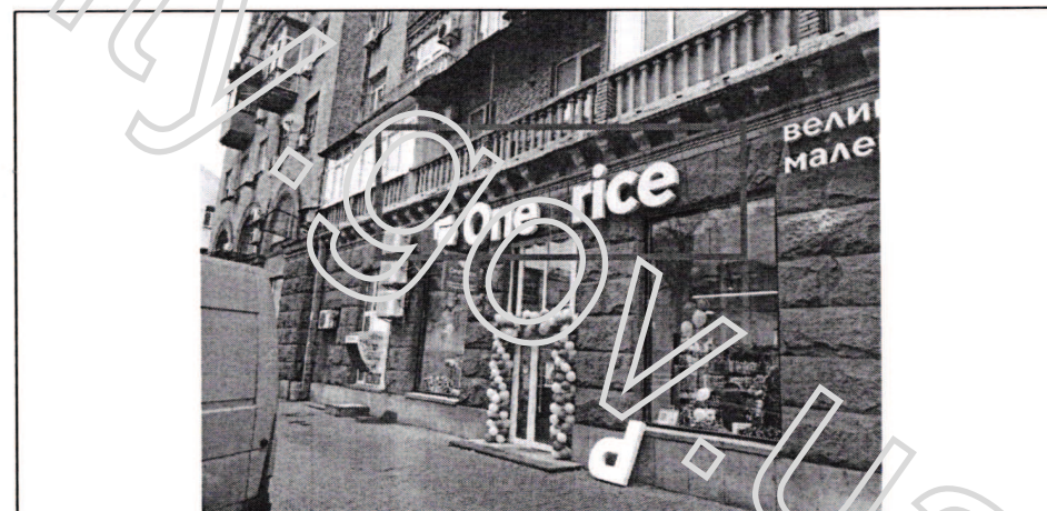
Фото фасаду розміщення спеціальної тимчасової/стаціонарної конструкції: