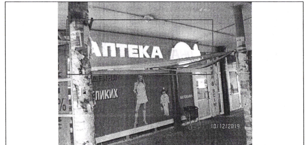
Фото фіксація розміщення спеціальної тимчасової/стаціонарної/стаціонарної конурукції: