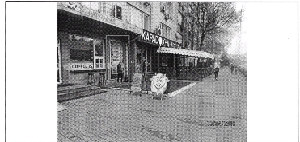
Фото фіксація розміщення спеціальної тимчасової/стаціонарної конструкції: