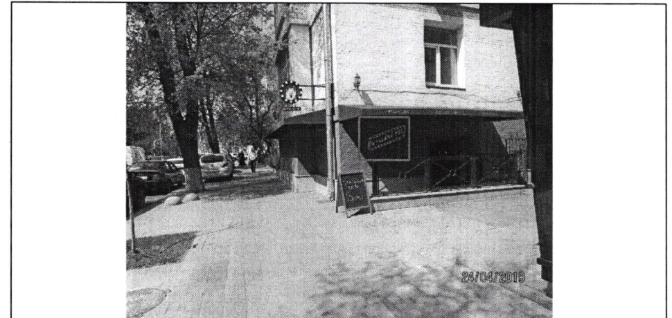
Фото фіксація розміщення спеціальної тимчасової/стаціонарної конструкції: