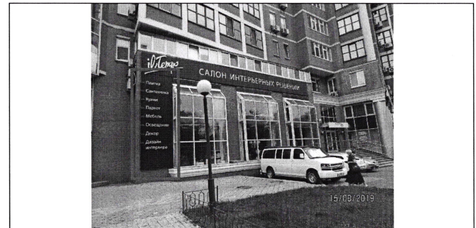
Фото фіксація розміщення спеціальної тимчасової/стаціонарної конструкції: