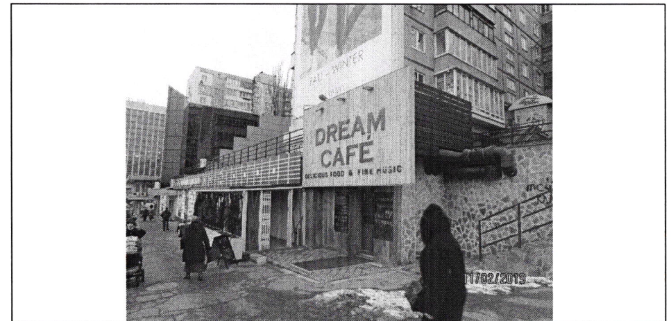
Фото фіксація розміщення спеціальної тимчасової/стаціонарної конструкції: