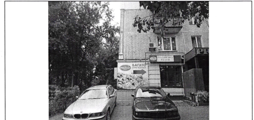
Фото фіксація розміщення спеціальної тимчасової/стаціонарної конструкції: