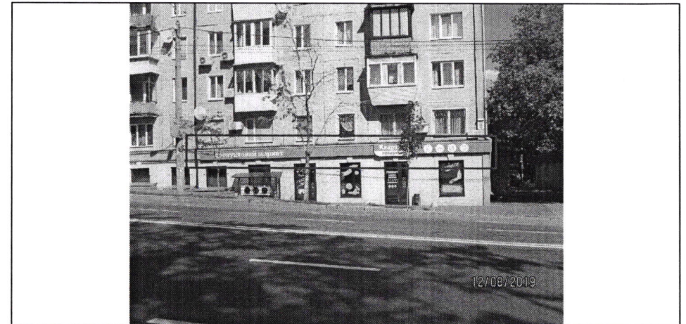
Фото фіксація розміщення спеціальної тимчасової/стаціонарної конструкції: