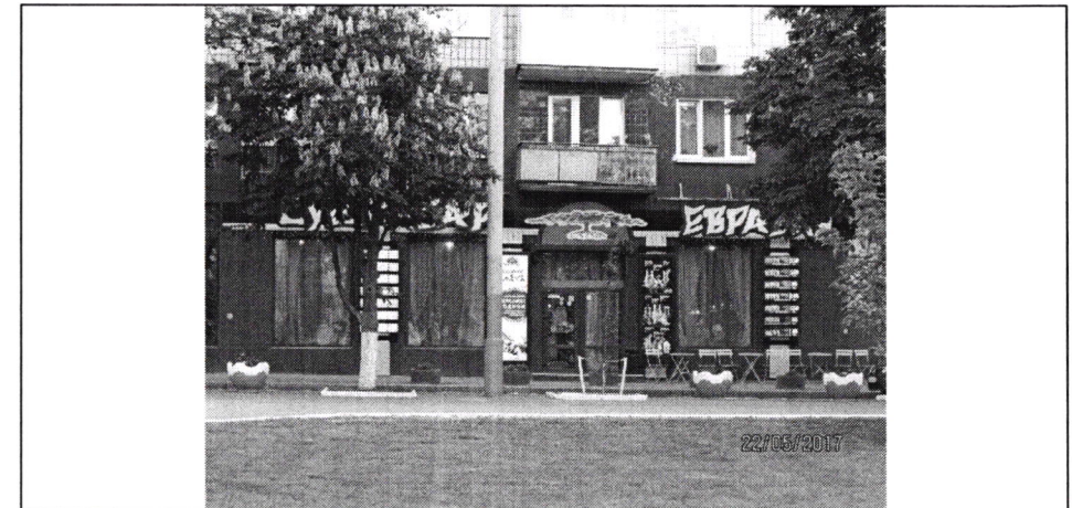
Фото фіксація розміщення спеціальної тимчасової/стаціонарної конструкції: