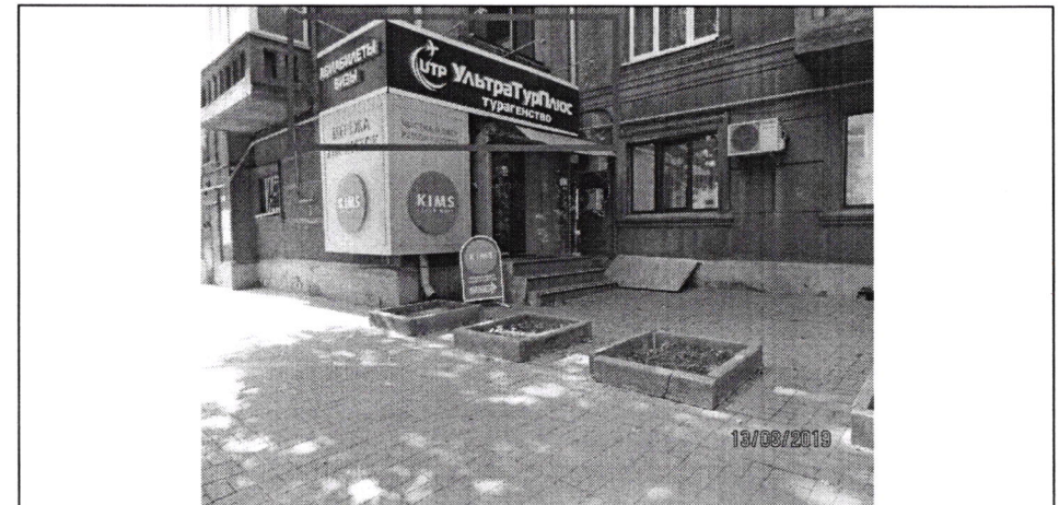
Фото фіксація розміщення спеціальної тимчасової/стаціонарної конструкції: