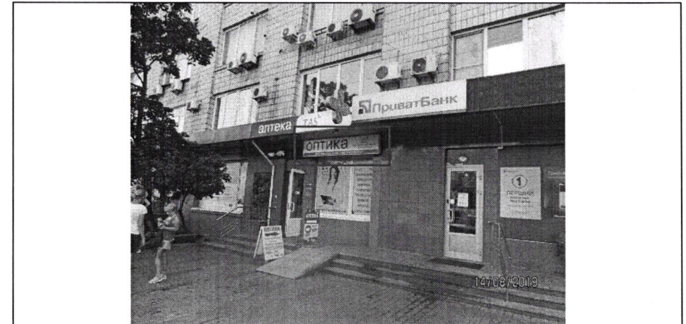
Фото фіксація розміщення спеціальної тимчасової/стаціонарної конструкції: