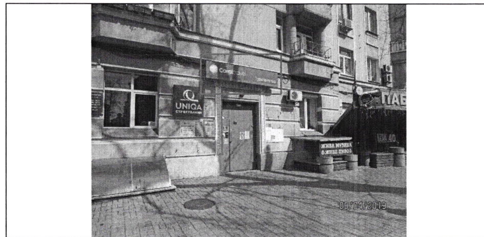
Фото фіксація розміщення спеціальної тимчасової/стаціонарної конструкції: