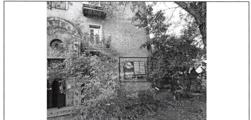
Фото фіксація розміщення спеціальної тимчасової/стаціонарної конструкції: