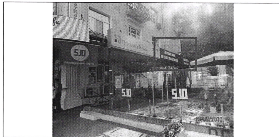
Фото фіксація розміщення спеціальної тимчасової/стаціонарної конструкції: