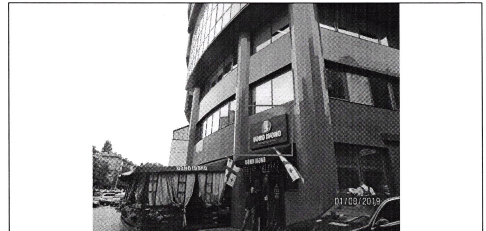
Фото фіксація розміщення спеціальної тимчасової/стаціонарної конструкції: