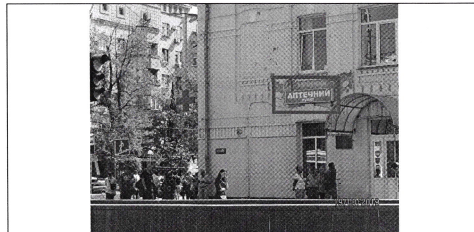
Фото фіксація розміщення спеціальної тимчасової/стаціонарної конструкції: