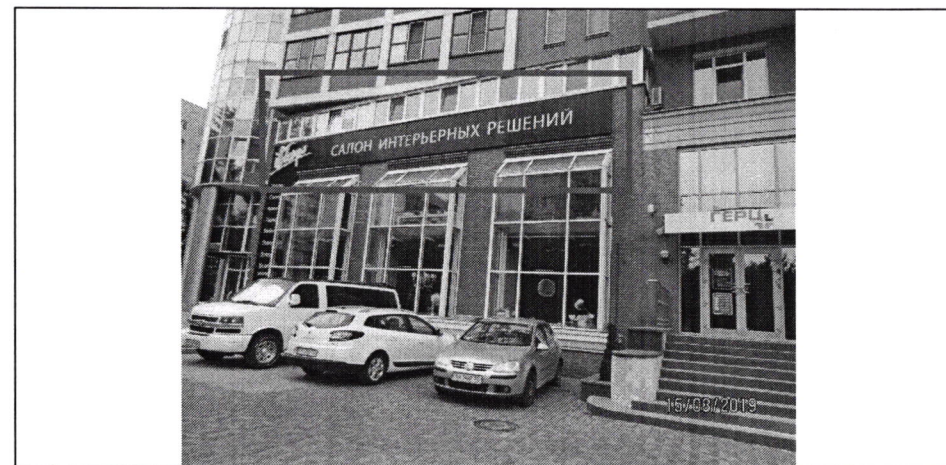
Фото фіксація розміщення спеціальної тимчасової/стаціонарної конструкції: