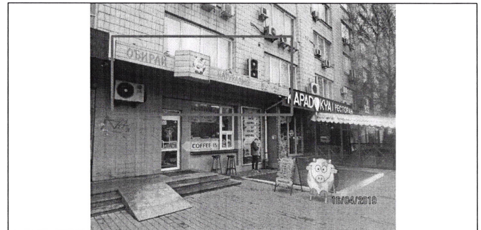
Фото фіксація розміщення спеціальної тимчасової/стаціонарної конструкції: