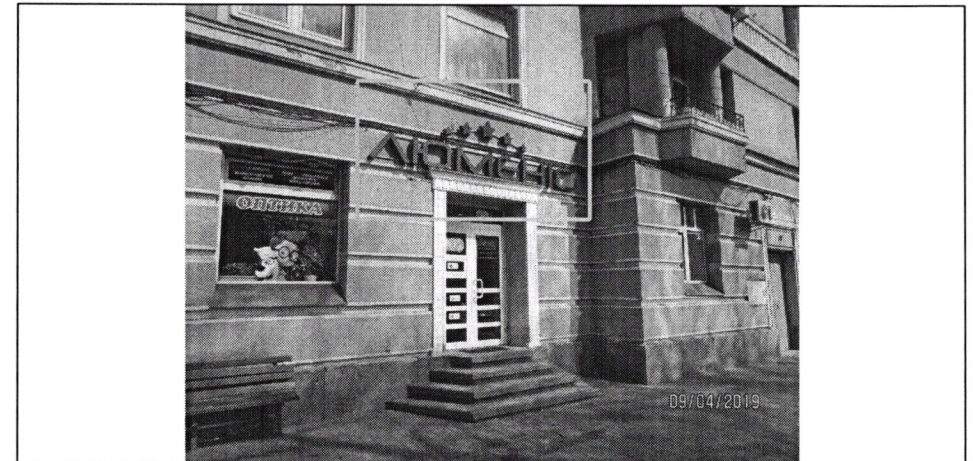
Фото фіксація розміщення спеціальної тимчасової/стаціонарної конструкції: