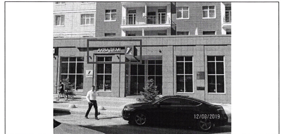
Фото фіксація розміщення спеціальної тимчасової/стаціонарної конструкції: