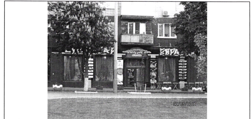
Фото фіксація розміщення спеціальної тимчасової/стаціонарної конструкції: