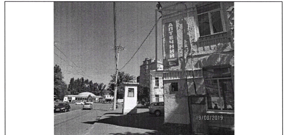
Фото фіксація розміщення спеціальної тимчасової/стаціонарної конструкції: