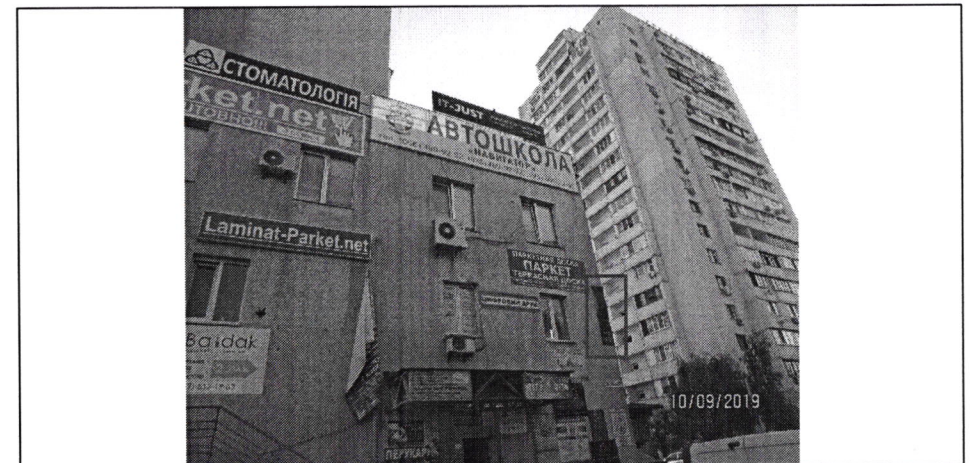
Фото фіксація розміщення спеціальної тимчасової/стаціонарної констукції: