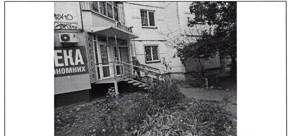
Фото фіксації розміщення спеціальної тимчасової/стаціонарної конструкції: