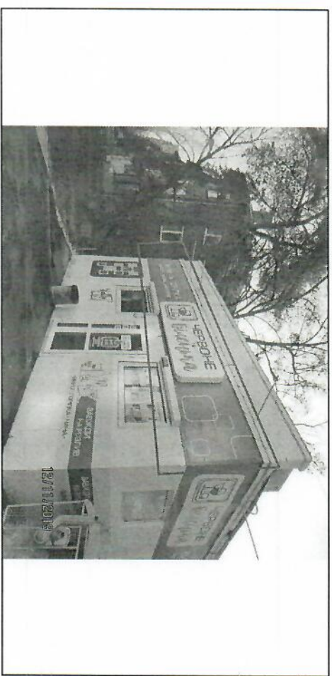
Фото фіксація розміщення спеціальної тимчасової/стационарної конструкції:

Підпис працівника відділу контролю та обліку рекламних засобів Управління з питань реклами виконавчого органу Київської міської ради (Київської міської державної адміністрації): Марценюк О.О.